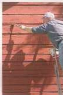
Rechterpagina, v.l.n.r.: moderne Zweedse villa's worden nog steeds met de rode verf uit Falun behandeld; in de verf fabriek testen ze zorgvuldig op de juiste kleur rood; pigmenten, van rood tot geel) worden gebruikt voor het maken van de verf; een eeuwenoud landhuis in Falu Rödfärg.

H et Zweedse landschap kenmerkt zich door spiegelende meren en groene bossen die loom over heuvels rollen. En tussen al dat groen van bladeren en dennennaalden en het glinsterend blauwgrijze water liggen talloze rode stipjes. Alsof een reus door het land is gestapt en met een rode viltstift overal punten heeft gezet. Waar je ook komt, en dan voornamelijk op het platteland, staan roodgeverfde houten huizen, stallen, schuren, paleizen en kerken. Oud en nieuw. Zelfs de allerkleinste houten bouwsels, de aandoenlijke buitentoiletten, zijn met een laagje rood bedekt.