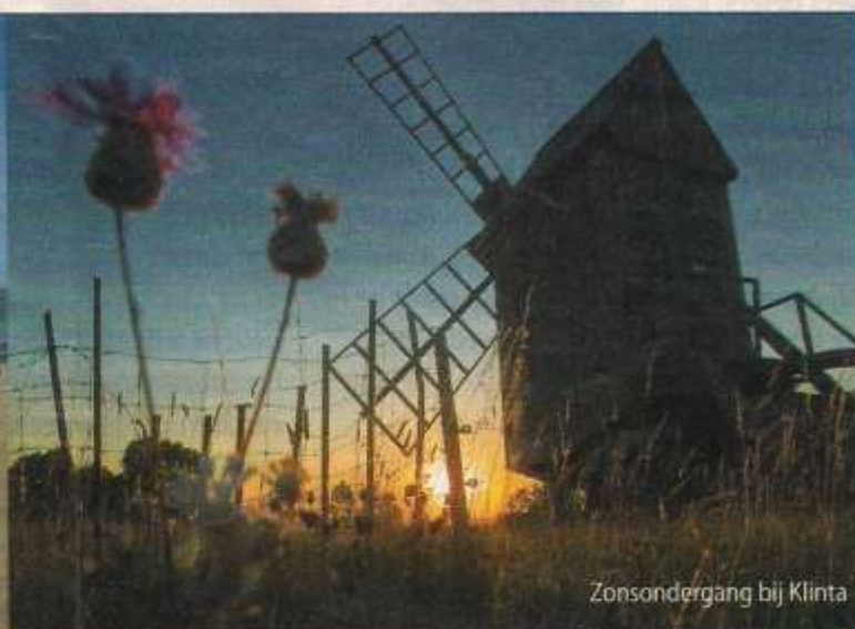
Zonsondergang bij Klinta