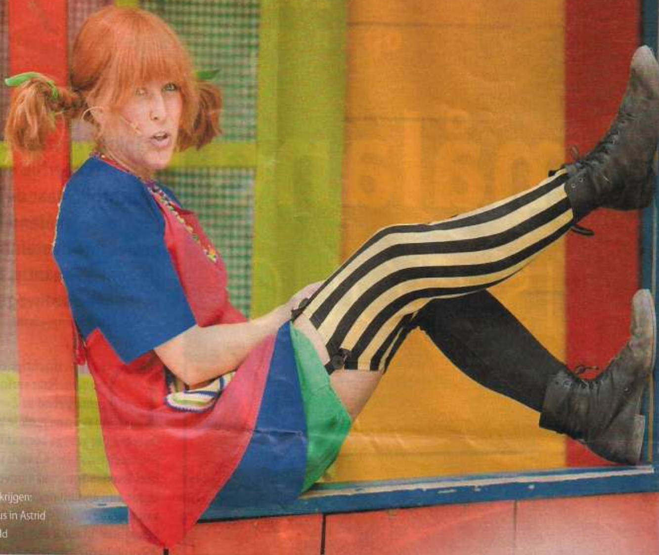
Niet kapot te krijgen: Pippi Langkous in Astrid Lindgrens Varld

Maar onder de oppervlakte borrelt het. Want bij Vimmerby ligt óók Zwedens populairste pretpark. Astrid Lindgrens Varld is een topattractie voor Zweedse kinderen (die kennen de verhalen van de Zweedse schrijfster uit het hoofd), maar ook Nederlandse kinderen kunnen zich helemaal verliezen in het prachtig aangelegde park. Hier geen mega-attracties, geen Disney-commerce. De nadruk ligt op lekker bewegen en genieten van de toneelstukjes die acteurs de hele dag door opvoeren. Pippi Langkous speelt en zingt, Karlsson van het dak propellert in het rond en uiteraard is ook Emil van de partij. De voertaal is Zweeds, maar Nederlandse kinderen hebben het hier veel te druk om zich over zo'n futiliteit druk te maken.