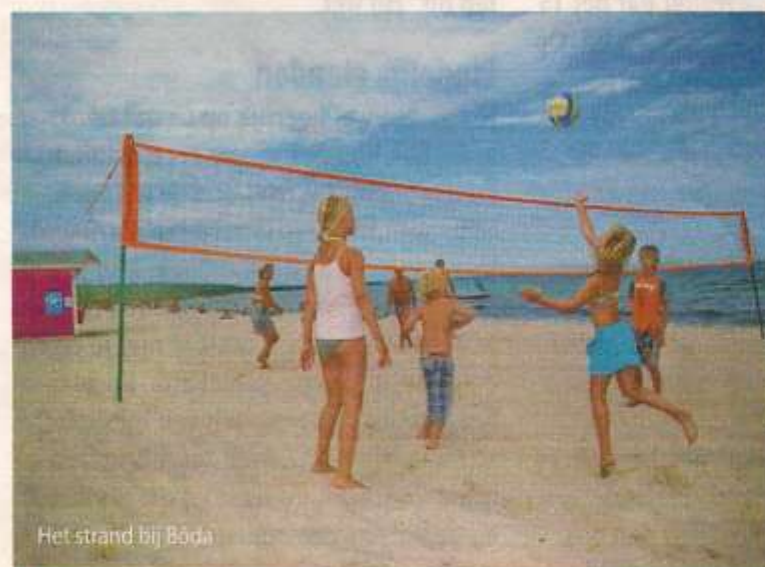
Het strand bij Böda